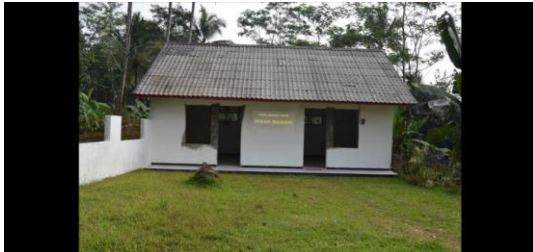
Gambar 5 Penampakan Papan Nama Panti Asuhan