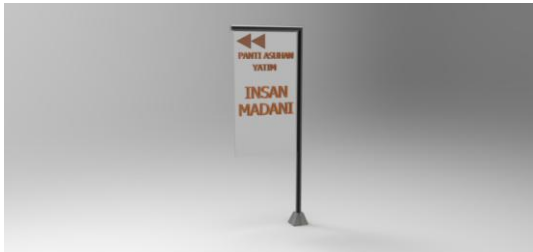
Gambar 8 Desain Petunjuk arah