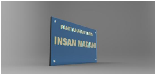
Gambar 7 Desain Papan Nama