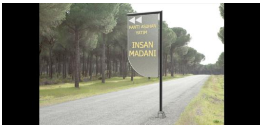
Gambar 9 Perkiraan Petunjuk Arah Setelah terpasang

diingat. Jika memiliki desain yang menarik unik, berbeda dengan yang lain otomatis akan lebih mudah diingat dibandingkan dengan desain yang biasa saja.