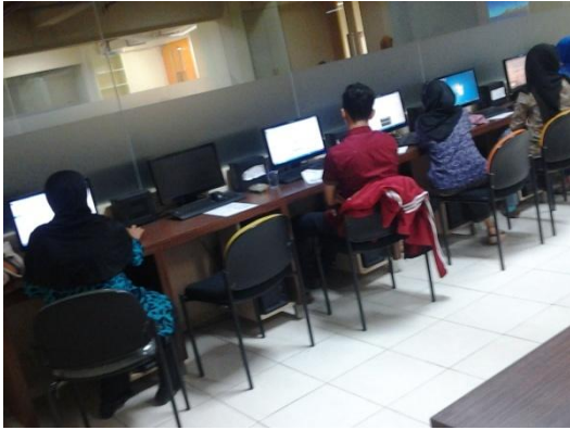
Gambar 4 Peserta latihan membuat blog on line