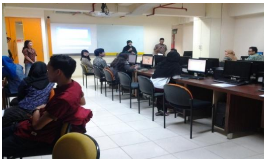
Gambar 1 Ceramah jualan on line

Pelaksanaan Pengabdian Masyarakat ini berlangsung pada hari selasa tanggal 24 Juni 2014 yang bertempat di Lab Komputer salah satu perguruan tinggi di kelurahan kre, Ciledug Tangerang.