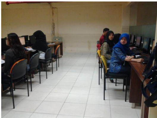
Gambar 5 peserta menunjukkan hasil akhir

Respon yang baik peserta tunjukan dengan sikap kooperatif antara karangtaruna dan para instruktur yang membuat suasana pengabdian masyarakat ini berupa pelatihan menjadi lebih bersahabat.