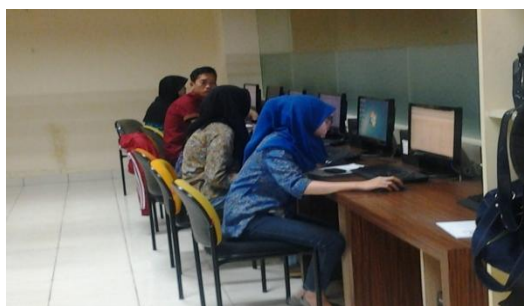
Gambar 2 Pengenalan penggunaan internet

Peserta yang hadir oleh remaja wanita dan laki-laki berjumlah 25 orang dari target 30 orang dan pelaksanaan acara berlangsung sesuai jadwal yang telah ditetapkan.