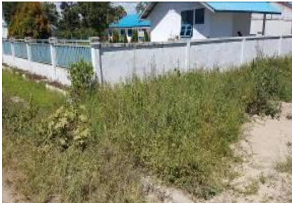
Gambar 4 Tampak depan kanan area