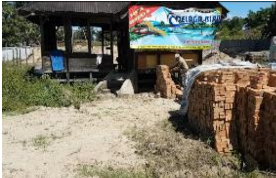
Gambar 3 Tampak depan area parkir

Delaga Biru yang berlokasi di Jl. Prof. Tarnama Sinambela, sebelah Puskesmas Narumonda, Kec. Siantar Narumonda, Porsea, Kab. Tobasa.