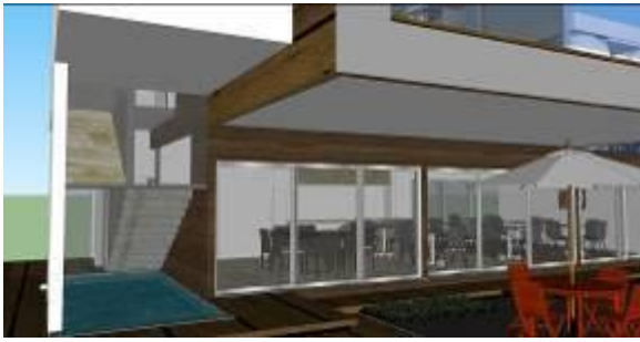
Gambar 12 Kajian Pemodelan