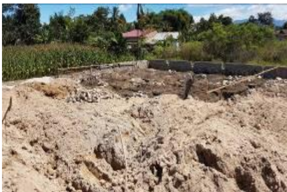
Gambar 5 Tampak belakang daerah restoran

Perancangan fasilitas restoran pada kawasan Delaga Biru. Pengunjung yang menginap akan otomatis mendapatkan fasilitas tersebut dan restoran juga terbuka untuk umum.