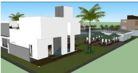
Gambar 14 Kajian Pemodelan