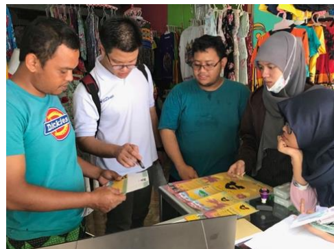
Gambar 3 Penulis dalam Pengabdian Kepada Masyarakat di Pulau Untung Jawa

Analisis awal di paparkan secara deskripsi pada masing-masing obyek melalui pengamatan intensif dengan bantuan dokumentasi berdasarkan kategori yang sudah ditentukan sebelumnya. Penarikan dalam kesimpulan berupa deskripsi dari hasil analisis yang akan menjawab perumusan masalah penelitian ini.