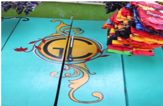
Gambar 4 Logo Awal Gibran Collection dengan Efek Daun

Hal ini akan mengakibatkan hilangnya differensiasi (perbedaan) antara logo perusahaan satu dengan lainnya. Sehingga logo-logo yang ada lebih terkesan mirip atau identik dan tidak kreatif. Kalaupun ada perbedaan, itupun tidak bergeser terlalu jauh.