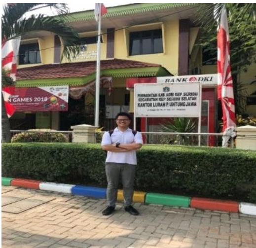
Gambar 2 Penulis dalam Pengabdian Kepada Masyarakat di Pulau Untung Jawa

Diawali dari Kunjungan penulis ke ke Pulau Untung Jawa untuk melihat situasi Usaha Kecil Menengah disana dilakukan pada 1 Maret sampai dengan 31 Mei 2018, bersamaan dengan kunjungan mahasiswa desain ke Pulau Untung Jawa dalam rangka kunjungan Tinjauan Desain Komunikasi Visual tahun 2018. Pada kunjungan tersebut di-bicarakan kemungkinan penulis melakukan Pengabdian kepada masyarakat setelah melakukan pertemuan dengan pemilik Usaha Kecil Menengah Toko Gibran Collection . Pelaksanaan disepakati dengan tenggat waktu lebih kurang 3 bulan setelah dari pertemuan ini. Pelaksanaan P2M ini melibatkan beberapa pokok yang dibahas selain logo. Pokok bahasan yang lain adalah tentang media promosi dan signage pada UKM di Pulau Untung Jawa.