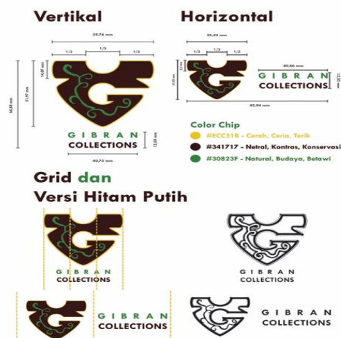
Gambar 6 Grid Pada Logo