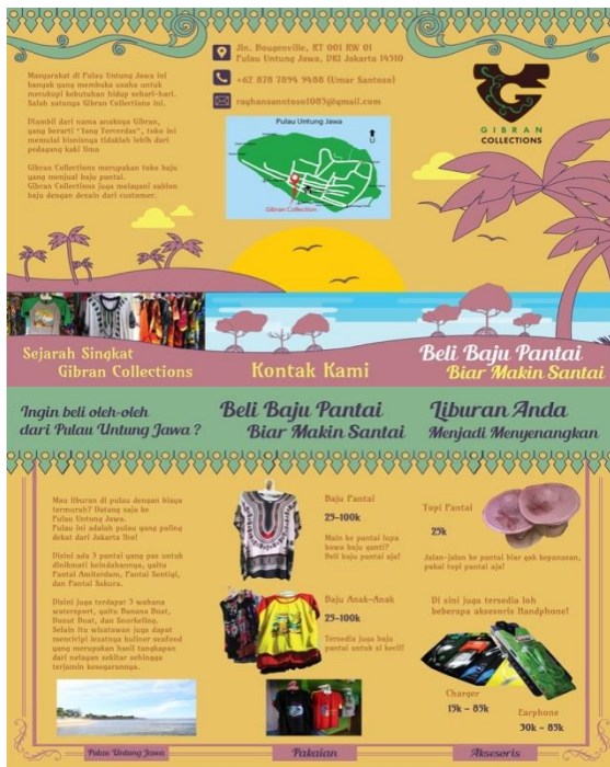
Gambar 7 Brosur Leaflet

Leaflet adalah sebuah informasi yang dicetak di selembur kertas kecil agar mudah dibagikan dan dibawa orang. Terkadang, selembur leaflet dilipat jadi dua atau tiga supaya terlihat lebih ringkas dan praktis. Tujuan dari leaflet adalah untuk menyebar luaskan suatu informasi. Leaflet biasanya dicetak dalam jumlah banyak dan dibagikan ke masyarakat yang menjadi target penyimpanan informasinya.