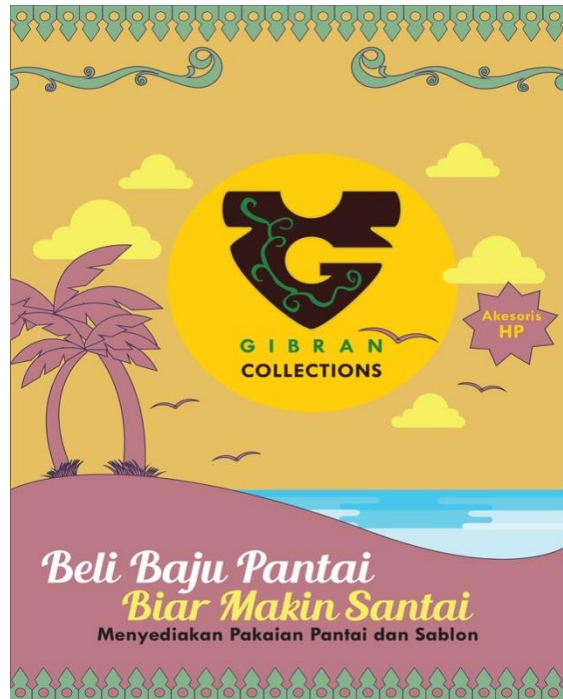
Gambar 9 Banner

Banner atau spanduk adalah kain membentang dan biasanya berada di tepi-tepi jalan yang berisi tulisan, warna dan gambar. Dengan melihat spanduk yang menarik, konsumen pun akan tertarik untuk membeli produk atau jasa yang ditawarkan. Spanduk memang menjadi media promosi yang murah dan efektif untuk saat ini