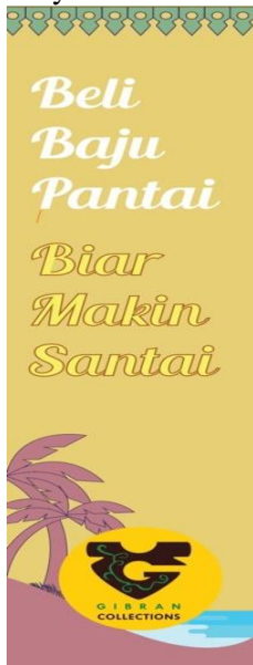
Gambar 11 Plang Nama

Plang nama akan dibuat sebagai papan notifikasi akan keberadaan Toko Gibran Collection. Plang akan dipasang didepan Toko serta beberapa lokasi strategis lainnya di Pulau Untung Jawa.