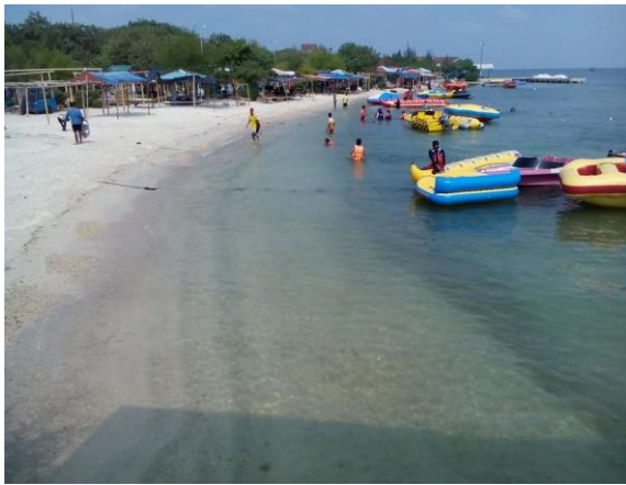
Gambar 1 Aktifitas di Pulau Untung Jawa

Media promosi yang ideal dipergunakan untuk membangun semangat dalam penjualan yang ada di dalam usaha tersebut. Sebuah media promosi yang baik dan berhasil akan dapat membangun kepercayaan, rasa memiliki daya Tarik beli, dan menjaga image toko tersebut. Keinginan dari pemilik adalah untuk melakukan Pembuatan media promosi untuk Toko Gibran Collection yang bertujuan untuk melakukan strategi pemasaran yang baik. Serta dalam perencanaan media promosi memiliki tujuan terhadap target audience sesuai dengan produknya merupakan pakaian yang bisa dimanfaatkan semua lapisan masyarakat.