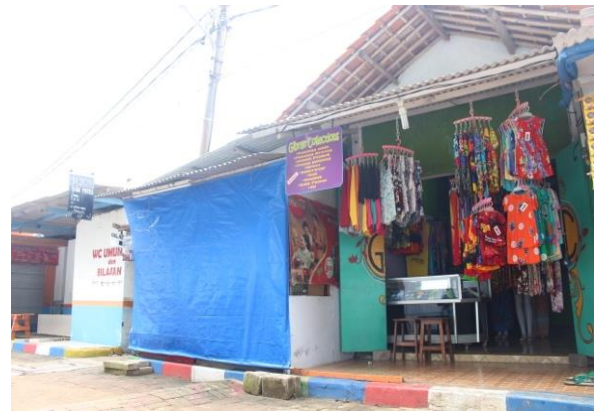
Gambar 2 Situasi Toko Gibran Collection

online atau online marketing sedang gencar-gencarnya, namun kita juga tidak bisa memungkiri bahwa pengaruh promosi offline juga cukup besar terhadap penjualan. Oleh karena itu untuk melakukan promosi dengan cara konvensional, yaitu dengan cara menyebar brosur, iklan koran dan media cetak, atau jika punya modal lebih kita juga bisa beriklan di papan reklame.