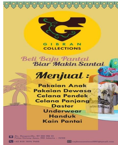
Gambar 8 Flyer

Flyer adalah daftar harga produk dan jasa yang terdapat di sebuah Toko.