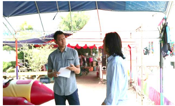
Gambar 3

Analisis awal di paparkan secara deskripsi pada masing-masing obyek melalui pengamatan intensif dengan bantuan dokumentasi berdasarkan kategori yang sudah ditentukan sebelumnya. Penarikan dalam kesimpulan berupa deskripsi dari hasil analisis yang akan menjawab perumusan masalah penelitian ini.