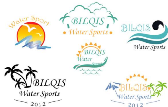
Gambar 7 Brainstorming logo Bilqis Watersport