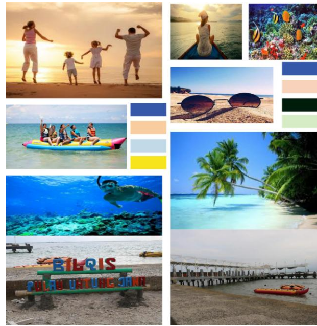
Gambar 5 MoodBoard

Kami ingin memberikan kehangatan. Tema besar dalam TVC ini adalah pantai. Pantai bukanlah tempat wisata, pantai adalah perasaan. Oleh karena itu kami ingin memberikan kesan itu melalui karakter maupun visual. Kami ingin menyampaikan perubahan bertahap dari awal hingga akhir TVC ini. Pendekatan ini kami pilih agar penonton bisa merasakan perubahan yang signifikan melalui cerita, karakter, dan visual.