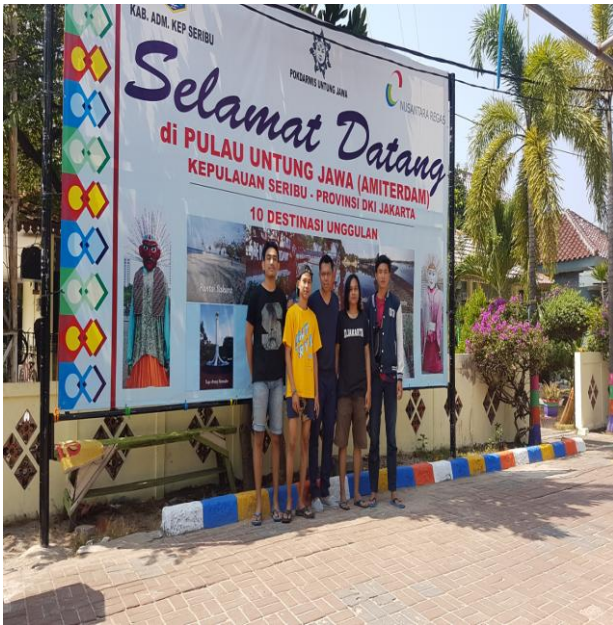
Gambar 2

Penulis dalam Pengabdian Kepada Masyarakat di Pulau Untung Jawa