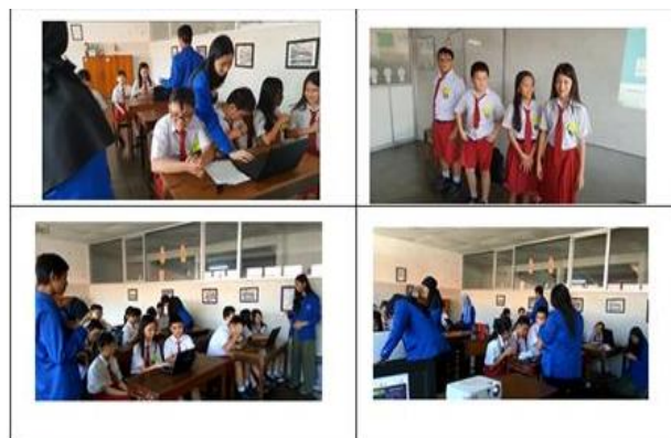
Gambar 1 Proses kegiatan pengabdian kepadamasyarakat di SD Hati Kudus

kelompok telah menyelesaikan poster yang mereka buat dan dikumpulkan di laptop tim dan mempersilahkan mereka untuk meninggalkan kelas karena kelas 5B akan melakukan hal yang sama. Kelas 5A dan kelas 5B akan mempresentasikan hasil karya mereka di hari berikutnya.