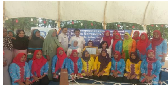
Gambar 1 Kegiatan Pengabdian Masyarakat di Kepulauan Seribu