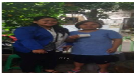
Gambar 4 Dengan Wali Murid Nurul Huda

Manfaat dari KJP Plus untuk SPP keperluan sekolah, membeli sepatu, seragam dan sembako.