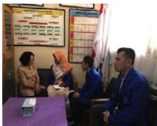
Gambar 2 Wawancara Pihak SDN 09

Kepala Sekolah ikut mengawasi berjalannya proses program KJP Plus.