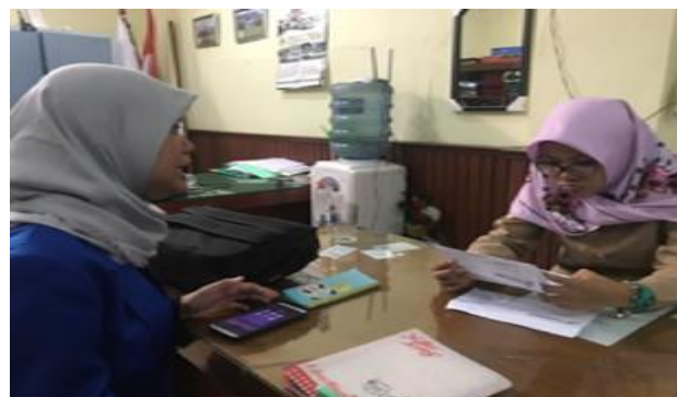
Gambar 3 Wawancara Pihak SMP Nurul Huda

Faktor Penghambat dalam mengurus KJP Plus adalah, orang tua siswa/i telat mengirim persyaratan dan formulir, Pencairan dana kjp plus terkadang telat.