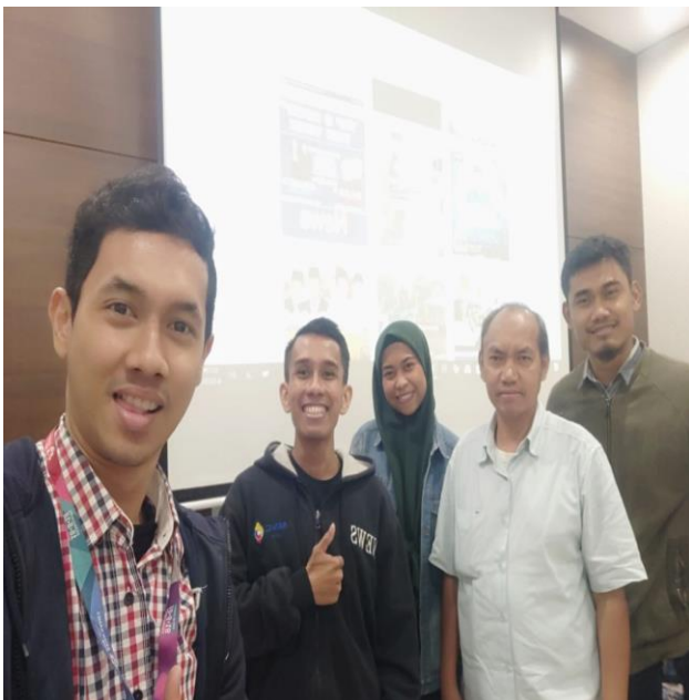
Gambar 2 Bersama Peserta Usai Pelatihan

Begitu juga memasuki isi berita harus dibuat dengan kalimat menarik dan sepadat mungkin. Jangan terlalu berlebih-lebihan karena pembaca media online memiliki karakter yang ingin sekedar