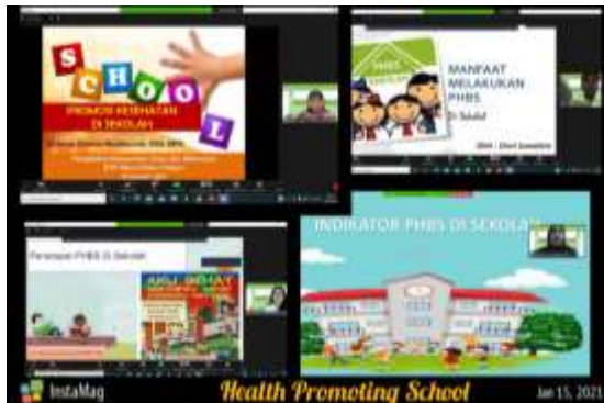
Gambar 2 Pemaparan Materi oleh Narasumber

kesehatan di sekolah, pengertian dan manfaat PHBS, sasaran PHBS di sekolah, masalah PHBS di sekolah, indikator PHBS di sekolah, dan upaya meningkatkan PHBS di sekolah.