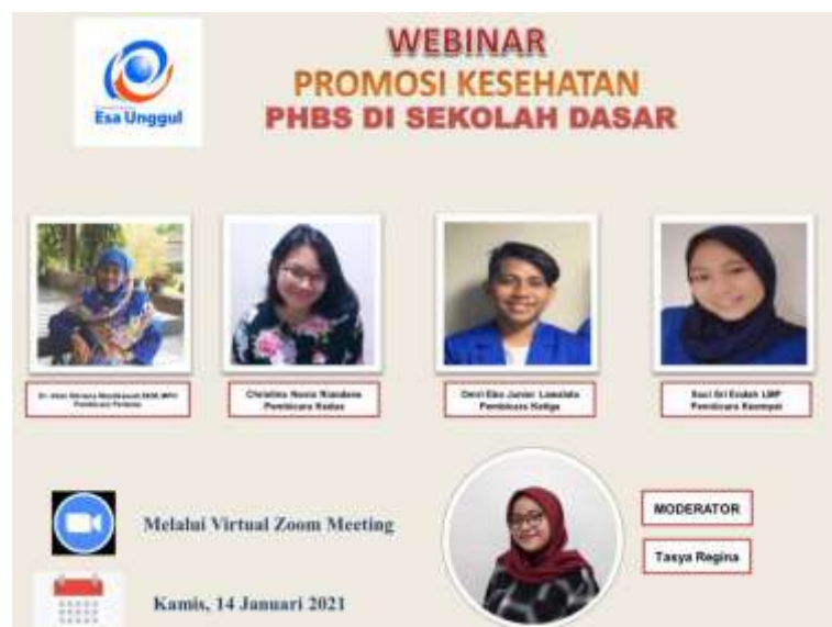
Gambar 1 Flyer Kegiatan Promosi Kesehatan

Kegiatan pengabdian kepada masyarakat dilaksanakan dalam bentuk promosi kesehatan secara daring menggunakan aplikasi Zoom Meet . Metode promosi kesehatan yang digunakan yaitu berupa ceramah dan diskusi yang bertujuan untuk memberikan informasi dan edukasi mengenai PHBS di sekolah. Sasaran dalam kegiatan ini yaitu siswa kelas 6 SDN Kebon Dalem Cilegon, Banten. Media yang digunakan dalam promosi kesehatan yaitu bahan presentasi menggunakan Microsoft Power Point .