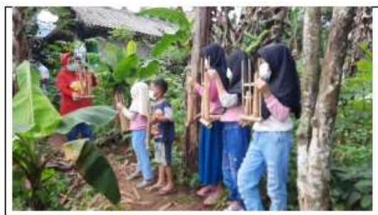
Gambar 7 Peragaan Metode Hand Sign Kodaly oleh Team Abdimas Universitas Unggul

pemahaman mengenai kode isyarat untuk nada yang akan dimainkan oleh instruktur pelatihan/dirigen dengan metode hand sign kodaly. Untuk lebih mudahnya pengajaran nada lagu dengan kode isyarat diberikan kepada ibu-ibu PKK secara virtual. Gambar 7 berikut adalah foto team yang mengajarkan metode Hand Sign Kodaly untuk not yang ada pada kedua lagu yang dipilih.