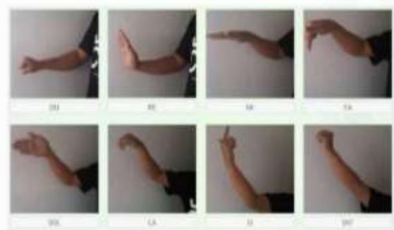
Gambar 4 Metode Hand Sign Kodaly

Adapun permainan angklung ini dilakukan secara berkelompok/ group dengan mengikuti instruksi dari instruktur pelatihan yang berfungsi sebagai dirigen. Metode pengarahan nada oleh dirigen yang digunakan adalah metode Hand Sign Kodaly yaitu metode gerakan tangan sebagai isyarat tinggi dan rendahnya nada yang sedang dimainkan. Untuk lebih jelasnya dapat dilihat pada gambar berikut ini: