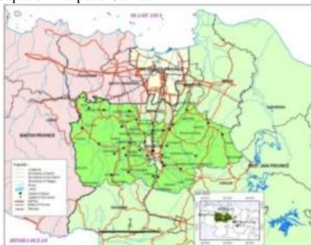
Gambar 1 Peta Orientasi Kecamatan Cigombong – Kabupaten Bogor

Secara administratif Desa Pasir Jaya terletak di Kecamatan Cigombong - Kabupaten Bogor - Provinsi Jawa Barat. Kecamatan Cigombong berada di selatan Kabupaten Bogor berbatasan langsung dengan Kabupaten Sukabumi. Untuk lebih jelasnya, lokasi Kecamatan Cigombong dapat dilihat pada Gambar 1.