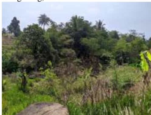
Gambar 3. Kebun Bambu di Desa Pasir Jaya

terdapat pula tanaman bambu yang tersebar pada ladang penduduk dan di sekitar jalan seperti terlihat pada Gambar 3, namun bambu tersebut belum dimanfaatkan secara optimal, terutama yang berkaitan dengan seni musik angklung. Hal ini mengingat penduduk belum mampu membuat alat musik angklung,