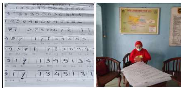
Gambar 8 Proses Pembuatan Not Lagu Manuk Dadali dan Tanah Airku

Selain diajarkan kepada ibu-ibu PKK, anak-anak juga diajarkan membaca not berdasarkan Hand Sign Kodaly dan not angka yang ditulis pada kertas lembaran. Team membuat tulisan lagu pada lembar kertas ukuran A1, sehingga mudah dibaca oleh anak-anak, seperti terlihat pada Gambar 8 .