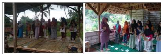
Gambar 9 Suasana Latihan memainkan alat Music beberapa anak-anak usia sekolah dasar di Desa Pasir Jaya

menjelaskan bagaimana memainkan alat music angklung, seperti terlihat pada Video. Selanjutnya dilakukan pada panggung masyarakat yang telah tersedia. Namun mengingat cuaca yang tidak mendukung, dan sering terjadi hujan, maka beberapa kali pembelajaran dilakukan di Musholla dekat panggung tersebut, seperti terlihat pada Gambar 9 .