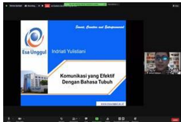
Gambar 2 Webinar Melalui Aplikasi Zoom

Peserta yang ingin mengikuti acara ini harus mendaftar terlebih dahulu secara daring melalui https://bit.ly/RegisFIA08 . Menjelang acara dimulai, para peserta dan narasumber dapat masuk ke aplikasi Zoom menggunakan link yang tersedia atau menggunakan Meeting ID : 82811658050 dan Passcode : 443950.