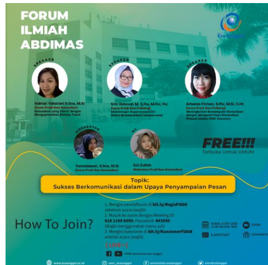
Gambar 1 Media Informasi Forum Ilmiah Abdimas

Sebelum pelaksanaan acara, informasi mengenai penyelenggaraan acara sudah disebarluaskan oleh penyelenggara dari LPPM Universitas Esa Unggul. Informasi disebarluaskan dengan menggunakan email dan media sosial serta grup whatsapp . Tujuannya, untuk menjangkau seluas mungkin target sasaran peserta yang terdiri dari kalangan akademisi, termasuk para dosen dan mahasiswa serta masyarakat umum lainnya.