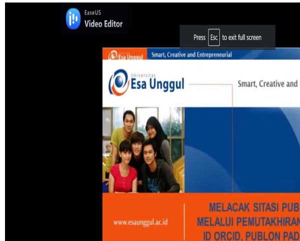
Gambar 3 Materi Kegiatan P2M