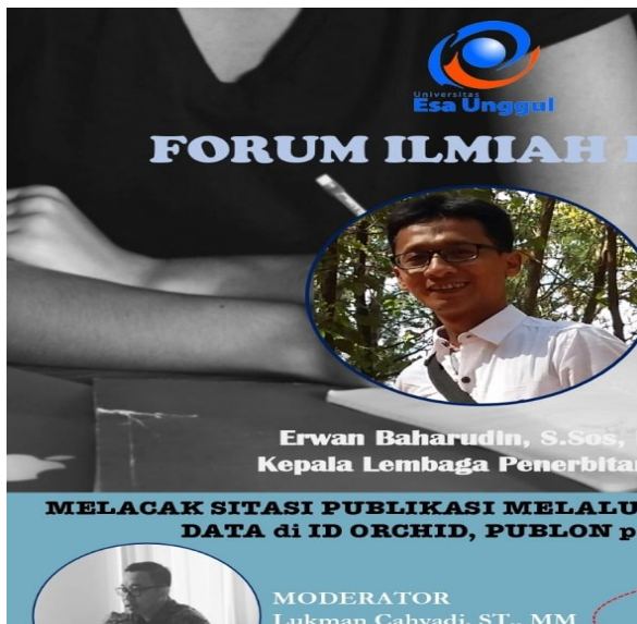
Gambar 1 Poster Acara P2M

Dalam tahapan ini dilakukan evaluasi melalui polling. Polling ini dilakukan setelah acara tanya jawab selesai. Dalam tahapan ini, tim selalu mengingatkan kepada para peserta untuk segera mengisi form evaluasi. Dari keseluruhan rangkaian kegiatan edukasi online, diharapkan materi pentingnya pembuatan ID pendukung publikasi dan updating data sinta dapat tersampaikan dengan baik di lingkungan universitas. Oleh karenanya, evaluasi kegiatan ini dilakukan sebagai masukan pada kegiatan edukasi lanjutan lainnya.