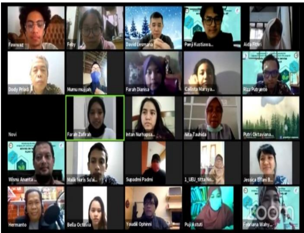
Gambar 3 Peserta webinar

Genetically Modified Organism (GMO) atau disebut juga Produk Rekayasa Genetika (PRG) merupakan bagian penting dalam perkembangan ilmu biologi terutama cabang ilmu bioteknologi. GMO adalah organisme (dalam hal ini lebih ditekankan kepada tanaman dan hewan) yang telah mengalami modifikasi genom (rangkaian gen dalam kromosom) sebagai akibat ditransformasi-kannya satu atau lebih gen asing yang berasal dari organisme lain (dari species yang sama sampai divisio yang berbeda). Gen yang ditransformasikan