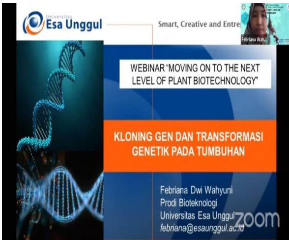
Gambar 2 Penyampaian materi

dilanjutkan dengan sesi diskusi untuk menjawab semua pertanyaan yang diajukan oleh peserta. Adapun materi yang disampaikan terkait dengan kloning gen dan transformasi genetik pada tumbuhan, dan materi yang didiskusikan adalah tentang teknik perakitan tanaman transgenik dan perkembangan tanaman transgenik di Indonesia.