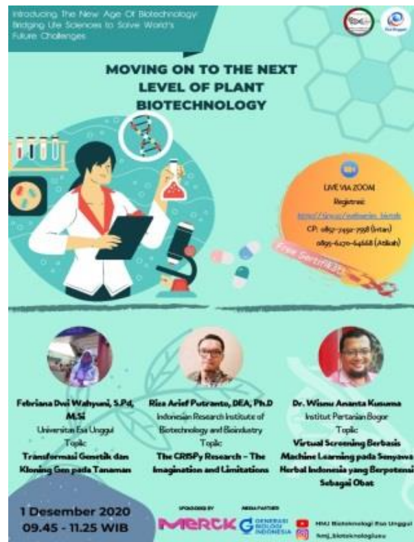
Gambar 1 Undangan online

Kegiatan diskusi dilakukan selama kurang lebih 30 menit, dimana ada sekitar 15 pertanyaan. Beberapa pertanyaan yang diajukan meliputi mekanisme masuknya gen asing ke dalam genom tanaman, trial and error proses transformasi, dan keamanan tanaman transgenik.