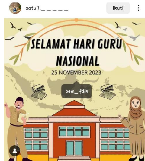
Gambar 4 Hasil Media Poster Digital (Instagram)

Bagi yang telah menyelesaikan konsep dengan tepat dan sesuai maka akan diberikan cinderamata oleh Tim Abdimas dan wajib siswa/i menyimpan karya dan mengunggah pada media sosial Instragram dan memberikan hastag (#pelatihan#abdimasFDIK#universitasesaunggul 1).