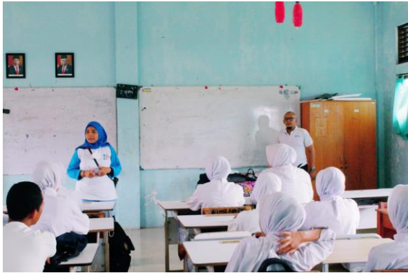
Gambar 1 Pengarahan oleh Tim FDIK pada Siswa/I SMKN 12 Tangerang