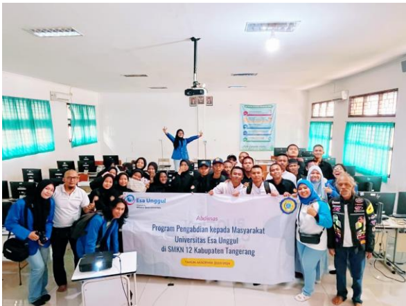
Gambar 2 Pelatihan Praktikum lab. Komputer oleh Tim FDIK pada Siswa/I SMKN 12 Tangerang

Saat pelaksanaan praktikum seluruh murid siswa-i diberikan alur proses pengerjaan, dimulai dengan menentukan ukuran poster secara custom dengan ukuran 158.75 x 158.75 cm. Kemudian dilanjutkan menentukan tema konsep melalui pencarian referensi yang telah ada. Dan diteruskan penerapan pada media canva.