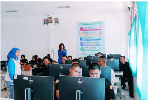
Gambar 3 Proses pengerjaan poster digital

Saat pelaksanaan praktikum seluruh murid siswa-i diberikan alur proses pengerjaan, dimulai dengan menentukan ukuran poster secara custom dengan ukuran 158.75 x 158.75 cm. Kemudian dilanjutkan menentukan tema konsep melalui pencarian referensi yang telah ada. Dan diteruskan penerapan pada media canva.