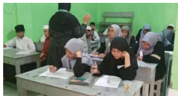
Gambar 6 Siswa fokus membuat mind-maps

Pada tahap ketiga seperti yang diuraikan sebelumnya, siswa diberikan pertanyaan terkait kosa kata Bahasa Inggris dan artinya dalam Bahasa Indonesia setelah terlebih dahulu menghafalkan, baik secara konvensional maupun dengan menggunakan mind-map yang sudah dibuat. Perbedaan yang terlihat antara kedua cara tersebut adalah siswa menjadi lebih mudah mengingat kosa kata Bahasa Inggris