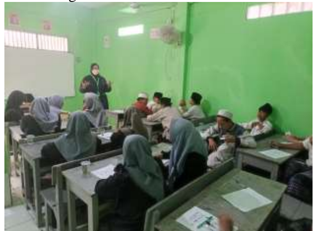
Gambar 4. Pengenalan teknik mind-mapping

membubuhkan warna-warna untuk membuat mind map tersebut terlihat indah dan mudah untuk diingat.