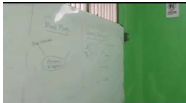
Gambar 5 Pemberian contoh mind-maps