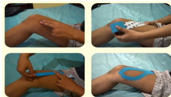
Gambar 1 Aplikasi Kinesiotape pada Otot Vastus Medialis Oblique

Pertama berikan fasilitasi pada otot vastus medialis oblique dengan menggunakan kinesiotape (KT) kurang lebih panjangnya 20 cm dan berikan potongan pada sisi tengah (potongan huruf Y) dan sisakan 5 cm sebagai jangkar. Fleksikan kaki kira-kira 30° dan letakkan jangkar pada origo VMO. Kemudian potongan taping diletakkan melingkari VMO dengan tarikan 25-50%.