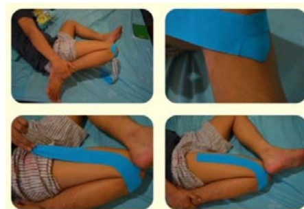
Gambar 3 Aplikasi Kinesiotape pada Otot Vastus Lateralis dan Illiotalibial Band

Untuk menginhibisi otot vastus lateralis dan illiotibial band posisikan pasien tidur miring dengan target kaki yang akan diberikan KT berada di atas. Kemudian pasien diminta untuk menekukkan kaki yang menjadi target, lalu panggul hiperekestensikan dan adduksikan. Hal tersebut untuk mengulur otot vastus lateralis dan illiotibial band . Dengan posisi tersebut berikan taping sepanjang otot vastus lateralis tanpa dipotong sisi tengahnya (bentuk huruf I) berikan jangkar 5 cm yang diletakkan di tuberositas tibia dan berikan tarikan ke proksimal 25%.