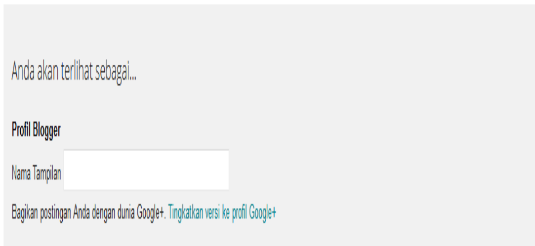
Gambar 3 Tampilan perintah penggunaan informasi profil pada weblog

Pengguna dapat mengisi secara bersinambungan dengan maksud dan tujuannya dengan penuh daya inovatif dan kreatif berbasis update data yang diawali dari sebuah judul dapat dilihat dibawah ini :