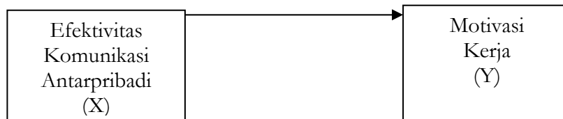
Gambar 1 Kerangka pemikiran penelitian

Oleh karena itu, dapat diduga bahwa efektivitas komunikasi antar pribadi memiliki hubungan dengan motivasi kerja karyawan pada perusahaan, yang dapat diilustrasikan dalam Kerangka Pikir berikut ini: