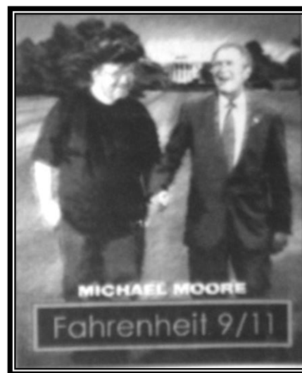
Gambar 2 Fahrenheit 9/11 (2004) karya Michael Moore

garapan Michael Moore, yang menuturkan konspirasi politik di Amerika Serikat (AS) terkait dengan peristiwa penabrakan pesawat udara – yang dianggap sebagai terorisme – pada dua gedung kembar World Trade Centre di New York.