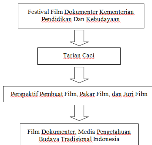
Gambar 4 Rancangan Penelitian

Penelitian ini desainnya termasuk tipe penelitian kualitatif dengan fokus kajian mengenai Film dokumenter, media pengetahuan budaya tradisional Indonesia, sebagai sebuah studi kasus dari ragam persepsi pembuat film "tarian caci", pakar film dan juri dalam festival film dokumenter, Kementerian Pendidikan dan Kebudayaan, maka penelitian ini menggunakan metode studi deskriptif, dengan pendekatan eksploratori.