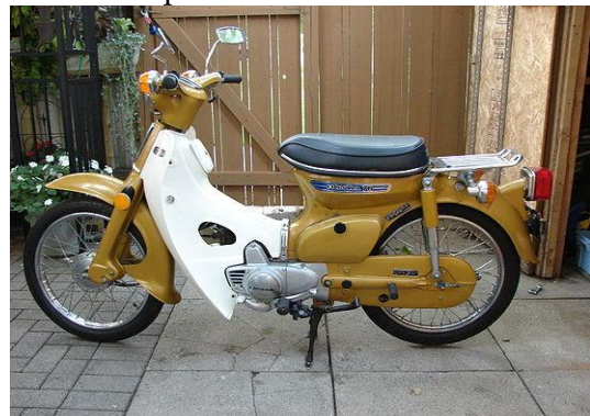
Gambar 1 Sepeda motor 70 CC

Berdasarkan pengertian-pengertian yang dikemukakan di atas maka sepeda motor apapun definisi dan batasannya tetap merupakan kendaraan yang digerakan secara mekanik oleh mesin yang memerlukan BBM baik beroda dua atau beroda tiga. Sepeda motor secara standar diciptakan sedemikian rupa oleh pabrikan guna memudahkan penggunaannya dalam memanfaatkan kendaraan tersebut. Perubahan bentuk fisik sepeda motor dari standar yang dikeluarkan oleh pabrikan berarti mengubah ciri asli dari sepeda motor sehingga mempengaruhi secara yuridis keberadaan sepeda motor tersebut.