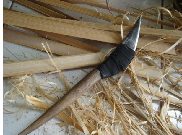
Gambar 3 Pisau Raut

Berikut ini gambar dari alat – alat yang digunakan dalam proses pembuatan Bubu :