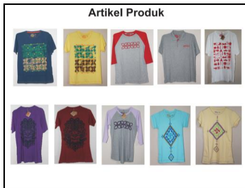
Gambar 38. Artikel Produk Nara's