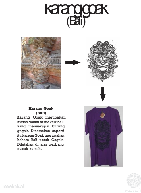
Karang Goak (Bali) Karang Goak merupakan hiasan dalam arsitektur Bali yang menyerupai burung gagak. Dinamakan seperti itu karena Goak merupakan bahasa Bali untuk Gagak. Diletakan di atas gerbang masuk rumah.