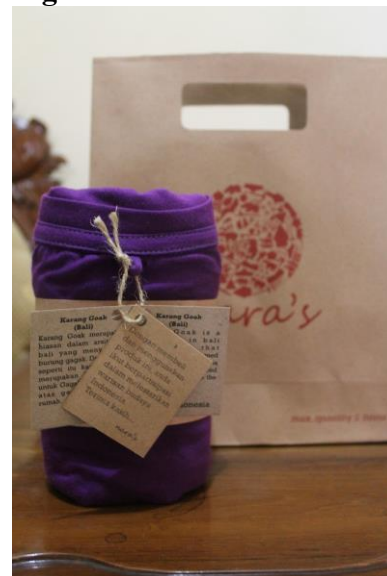
Gambar 37. konsep tag pada Produk Nara's

Dikemas dengan konsep yang modern tapi sustainable dalam aplikasi material yang digunakan, baik dari tag informasi produk motif yang digunakan, material tali dan shopping bagnya menggunakan bahan material daur ulang, sehingga menambah nilai lebih terhadap kepedulian akan pelestarian bahan baku kertas dan kayu sebagai bahan dasar. Begitu juga konsep warna yang digunakan senatural mungkin, berkesan warna coklat, seperti warna dasar pada kain batik biasanya sehingga semakin mendekati konsep Natural produk dari alam yang ramah lingkungan. Nilai edukasi menjadi konsep dasar dari Nara's produk sehingga orang lain mendapatkan informasi akan pengetahuan jenis dan asal motif dari daerah suku-suku bangsa Nusantara Indonesia.