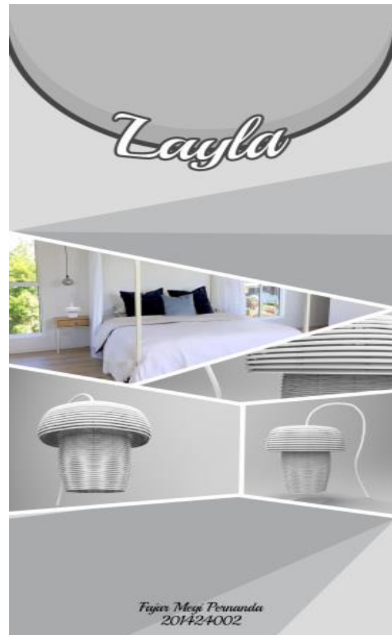
Gambar 7 layout