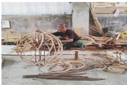
Gambar 2. Workshop RADEC https://socialmediafeed.me/ig/tags/radec

Melakukan workshop secara langsung, dengan melakukan workshop secara langsung dapat diketahui mengenai proses-proses pengerjaannya, mulai dari proses pemilihan rotan hingga pada proses penganyaman sampai barang jadi, mulai dari pembuatan kap lampu, instalasi, mebel, sampai perlengkapan-perengkapan kecil pada rumah. Dengan melakukan workshop langsung pun perancang dapat mengetahui tentang waktu pengerjaan dan seberapa sulit produk dibentuk berdasarkan desain yang dibuat.