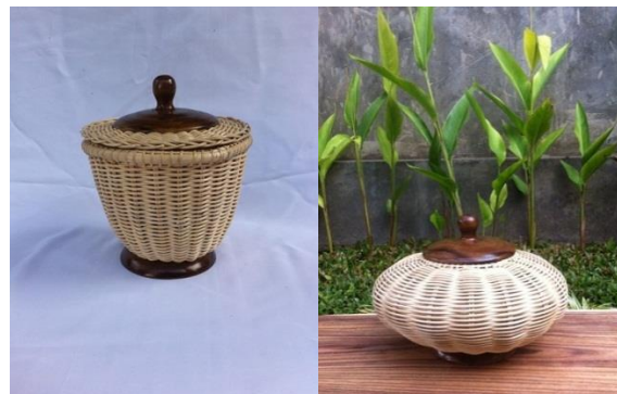
Gambar 3 Produk Reversi https://www.karyabina.com/detail-produk-OTU=-rengginang-gohan.html

Pada proses pengerjaannya pun perancang hanya menggunakan satu teknik yaitu teknik penganyaman, dikarenakan produk sudah harus jadi dalam waktu singkat kurang dari semalam, oleh karenanya perancang memperhitungkan proses dari pembuatan produk kap lampu tersebut guna menciptakan produk friendly tidak hanya dari pengaplikasiannya melainkan proses pembuatannya