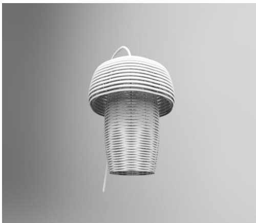
Gambar 4. 3D Modeling 1