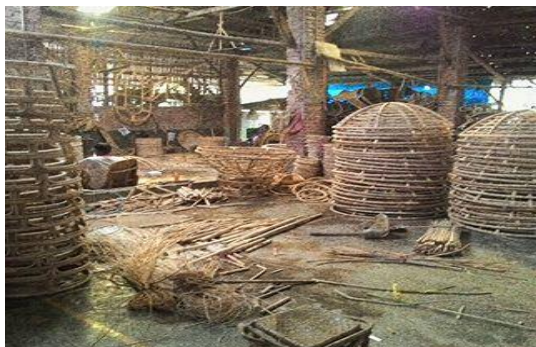
Gambar 1 Workshop RADEC https://socialmediafeed.me/ig/tags/radec

yang bervariasi, terlebih lagi apa yang sedang populer dan diminati oleh konsumen saat ini terhadap produk rotan yang dibuat.