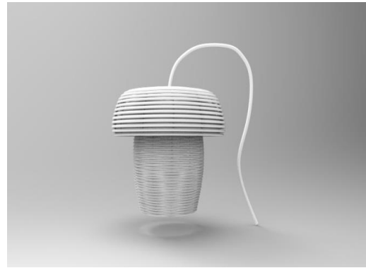
Gambar 5 3D Modeling 2