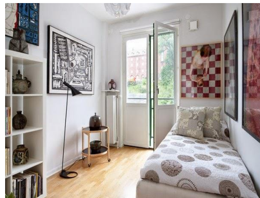
Gambar 1 Ruang minimalis

Bentuk rumah sekarang kebanyakan menggunakan style minimalis yang tak hanya bertujuan untuk menonjolkan sisi futuristik/masa depan dari pembangunan di Indonesia saja, tapi juga sebagai cara agar pembangunan perumahan dapat dimaksimalkan jumlahnya namun tetap menghemat lahan yang ada. Karena lahan tanah di Indonesia semakin sedikit jumlahnya, dikarenakan lebih banyaknya pembangunan mall, ritel atau pabrik-pabrik, yang memakan tempat lebih besar. Dengan menerapkan konsep minimalis dengan tipe rumah 21 membuat space rumah yang dimiliki sangat terbatas, meskipun begitu harga yang didapat cukup terjangkau untuk kalangan menengah keatas.