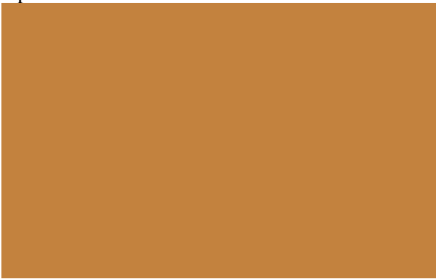
Gambar 4 Warna coklat muda

Warna yang digunakan untuk keranjang pakaian kotor ini adalah warna: warna natural ( warna coklat muda ) dan warna putih. Namun, pada desain keranjang ini warna natural coklat muda yang dipilih.