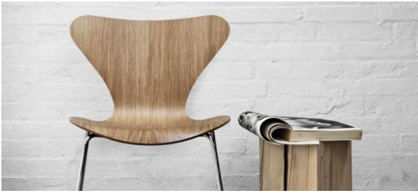
Gambar 3 Scandinavian Produk