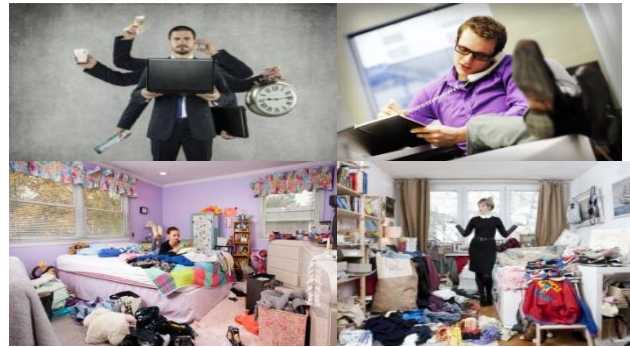
Gambar 6 User for the product

User adalah gambaran si pemakai yang akan memakai produk ini. User adalah image chart yang menggambarkan kehidupan si pemakai dan keseharian si pemakai.