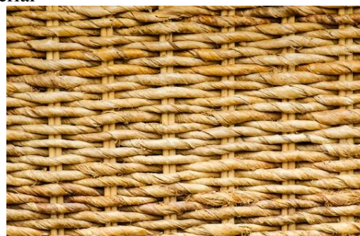
Gambar 2 Material rotan

Material yang digunakan adalah rotan. Jenis yang digunakan adalah rotan Dahanas dari