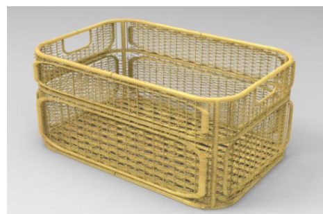
Gambar 8 Rendering result (realistic image)