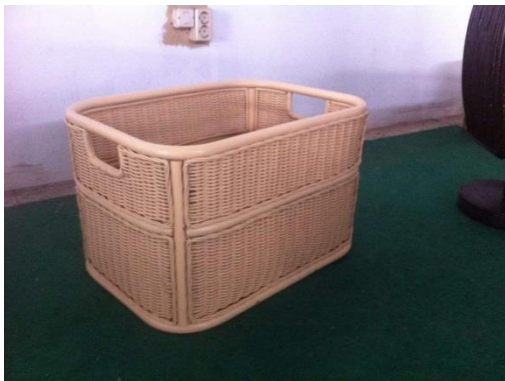
Gambar 10 Hasil jadi

Proses pengerjaan keranjang oleh pengrajin dari RADEC