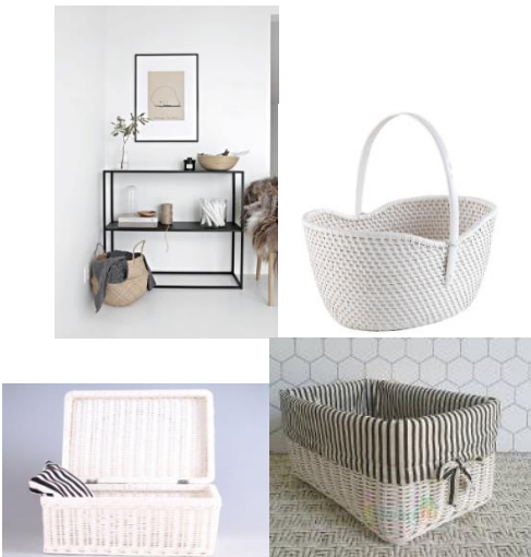
Gambar 5 Gaya perancangan

Gambar dibawah ini adalah konsep styling dari pembuatan desain kerancang.