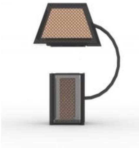
Gambar 2 Tampak samping