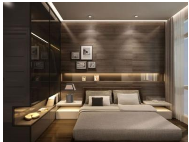
Gambar 6 Diorama