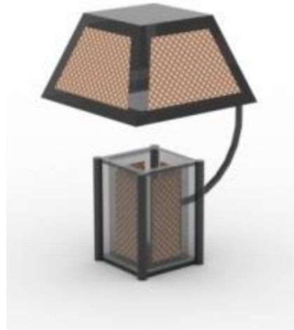
Gambar 5 Tampak perspektif