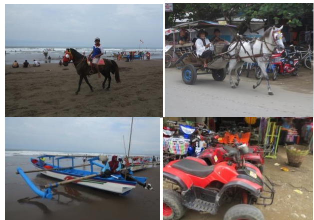
Gambar 1 Kendaraan Wisata di Pangandaran

empat. Penggunaan kuda dan delman ini masih bersifat tradisional. Sementara transportasi wisata yang digerakan oleh mesin, diantaranya ada sepeda listrik, perahu, dan motor ATV.