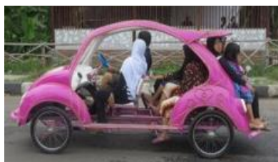
Gambar 10 Mobil Gowes di Siang Hari

menggunakan lampu LED yang disusun dan dipasang di bagian kerangka karakter kartun pada kap depan dan bagian sisi mobil gowes sehingga menimbulkan tekstur nyata pada mobil gowes. Untuk elemen ukuran pada visual dua dimensi karakter kartun ini tergantung dari bidang kap depan mobil gowes. Biasanya bidang yang digunakan terbilang besar dibandingkan dengan kap depan mobil odong-odong, sehingga visual dua dimensi karakter kartun yang ditampilkan lebih terlihat menyolok baik di malam hari maupun di siang hari.