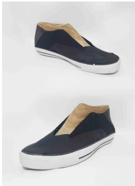
Gambar 5 Purwarupa ke-2