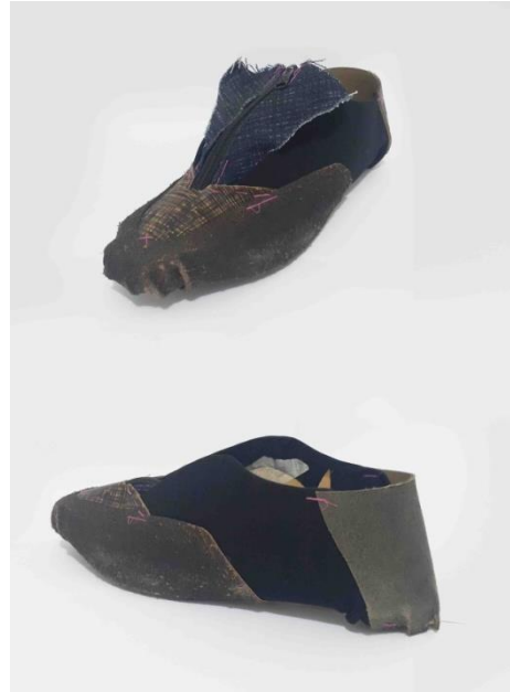
Gambar 4 Purwarupa pertama

Proses ini hampir sama dengan Developing & Refinement. Hanya data yang dikembangkan bisa diambil dari hasil pengamatan dan penelitian pada purwarupa yang telah dibuat.