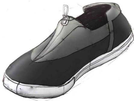
Gambar 6 Gambar desain pertama

Hasil desain yang diperoleh dari proses mengkaji, observasi, brainstorming , prototyping , serta berbagai proses mendesain yang telah dilakukan maka diperoleh hasil gambar desain sebagai berikut.