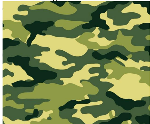
Gambar 1 Motif Camouflage