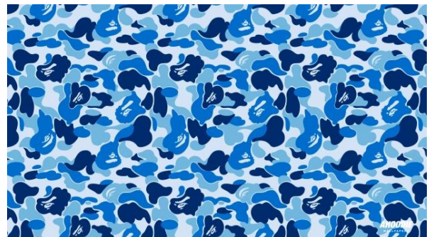
Gambar 2 Motif Camouflage Bathing Ape

Awalnya orang-orang militer tidak menggunakan baju loreng, mereka menggunakan warna-warna yang mencolok dan berani dengan