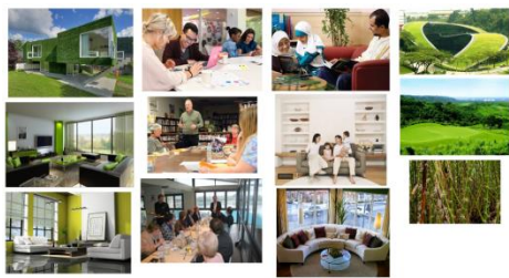
Environment: Chill and Greenery