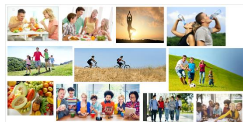
User Lifestyle: Social Healthly

Dalam perancangan sepatu ini user / pengguna yang ditargetkan adalah individu yang memiliki gaya hidup yang modern, dimana mereka selalu mengikuti perkembangan zaman dan tren yang terjadi. Individu yang memiliki profesi dalam dunia industri kreatif, public figur, maupun pengusaha-pengusaha muda yang memiliki rutinitas cukup padat.