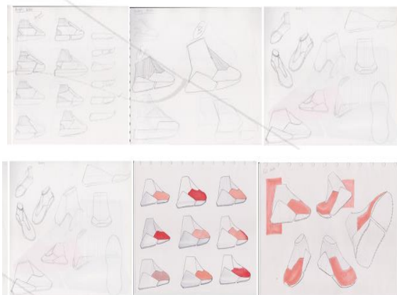
Gambar 5 Proses sketsa

Tahapan proses sketsa mulai dari basic structure, brainstorming, development sketch, expose sketch, sampai final sketch yang dilakukan sebagai proses visualisasi dari perancangan sebuah produk.