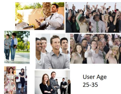
User Age 25-35