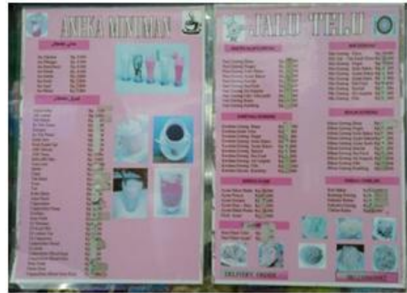
Gambar 3. Papan Menu Kantin Kios Jalu Telu

papan menu dari kios Jalu Telu terletak di kiri atas etalase. Papan menu tersebut menggunakan warna merah muda sebagai latar belakangnya.