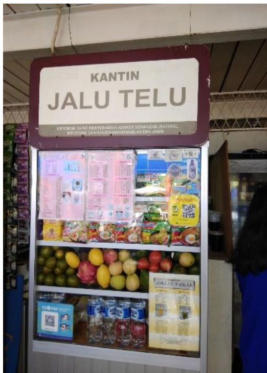
Gambar 2. Tampak Depan Kios Jalu Telu

Pada bagian ini Tim Peneliti akan mengambil sample dari salah satu kios penjual makanan di kantin Universitas Esa Unggul kampus Kebon Jeruk, Jakarta Barat. Berdasarkan hasil observasi Tim Peneliti, kios ini adalah kios yang paling ramai dikunjungi saat jam makan siang. Kios penjual tersebut pada papan namanya bertuliskan “Jalu Telu”.