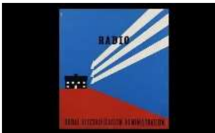
Gambar 4. Gaya Desain Late Modern