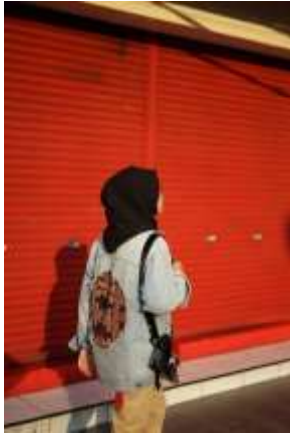
Gambar 1. Dekonstruksi Tenun Pada Denim