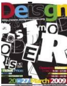
Gambar 5. Gaya Desain Post Modern

Karya pada post modern digunakan untuk mendeskripsikan implikasi sosial budaya serta seni kontemporer yang berkembang pada akhir abad 20 dan awal abad 21. Perkembangan ini ditandai dengan era globalisasi, era konsumerisme, dan komodifikasi pengetahuan. Pada Post modernisme merupakan sebuah kritik terhadap modernism dengan penolakan gaya hidup mapan generasi tua, sikap kritis yang mendukung paham atau isu-isu dunia ketiga, mengkomodifikasi sikap individu akibat tren budaya massa dan beberapa sub-budaya diluar budaya utama.