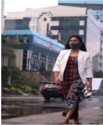
Gambar 3. Perubahan tenun di era modern

dengan teknik distressed dan burn-out menciptakan sebuah tampilan baru. Perancangan ini terdiri dari sebuah isi mengenai Lembata, proses pembuatan tenun Lembata, hingga sam-pai di akhir penerapan tenun pada denim dalam proses dekonstruksi yang dijadikan sebagai sebuah referensi pada media cetak buku.