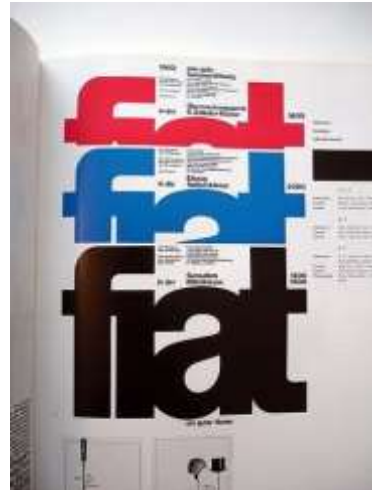
Gambar 6. Poster Contemporary Style

Seni Kontemporer adalah sebuah perkembangan seni yang terpengaruh dampak modernisasi dan digunakan sebagai istilah umum sejak istilah berkembang di Barat sebagai produk seni yang dibuat sejak Perang Dunia II. Gaya desain kontemporer sendiri merupakan perkembangan dari gabungan berbagai aliran desain yang menghadirkan visual baru yang dikenal dengan aliran kontemporer. Dengan pengembangan yang sangat dinamis dan bebas, bukan berarti kamu tak bisa mengenali gaya desain kontemporer pada interior dan arsitektur.