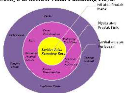
Gambar 1. Three Level of Product (Eksisting)

Berdasarkan data kependudukan Kecamatan Pamulang, terlihat bahwa koridor Jalan Pamulang Raya adalah bagian dalam Kelurahan Pamulang Barat merupakan kawasan yang paling padat dibanding dengan kelurahan lain. Ini merupakan sebuah ancaman bagi kawasan komersial, dengan penduduk wilayah yang cukup padat dapat meningkatkan volume bangkitan lalu lintas khususnya di koridor Jalan Pamulang Raya.