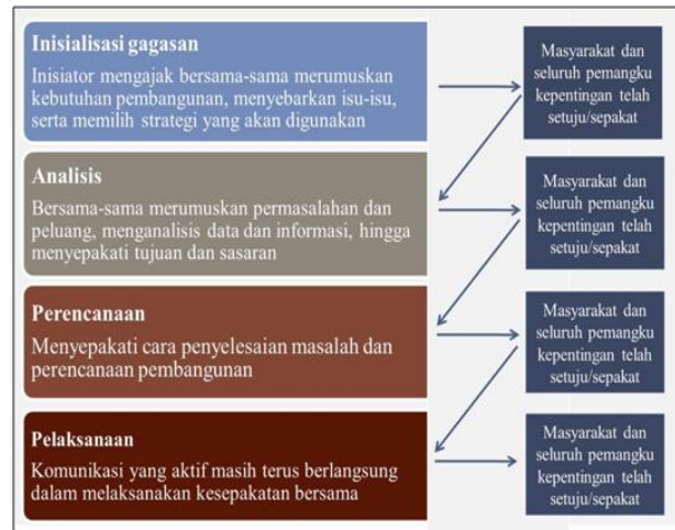
Gambar 1 Proses umum perencanaan komunikatif

disepakati bersama, bisa dilanjutkan pada tahapan analisis. Namun jika belum disepakati, tidak bisa dilanjutkan pada tahap selanjutnya. Begitu seterusnya hingga pada tahap pelaksanaan.