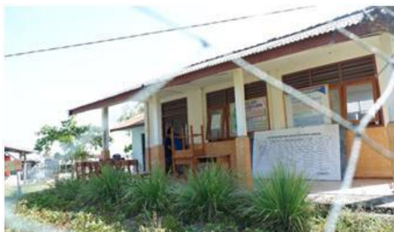
Gambar 1 Keadaan perpustakaan sekolah

Melihat permasalahan yang terdapat di wilayah tersebut maka pengabdian masyarakat ini dirancang mengikuti agenda kegiatan KKN Tematik Merajut Nusantara Tahun 2018 di bawah naungan Kopertis III DKI Jakarta.