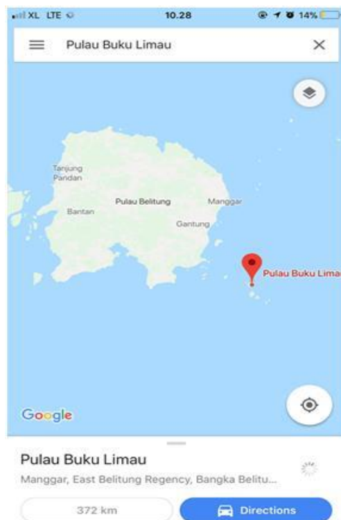
Gambar 2 Peta (denah) Lokasi Pulau Buku Limau, Belitung Timur.

Peta (denah) lokasi dengan beberapa tempat penting di sekitarnya terlihat dalam gambar berikut: